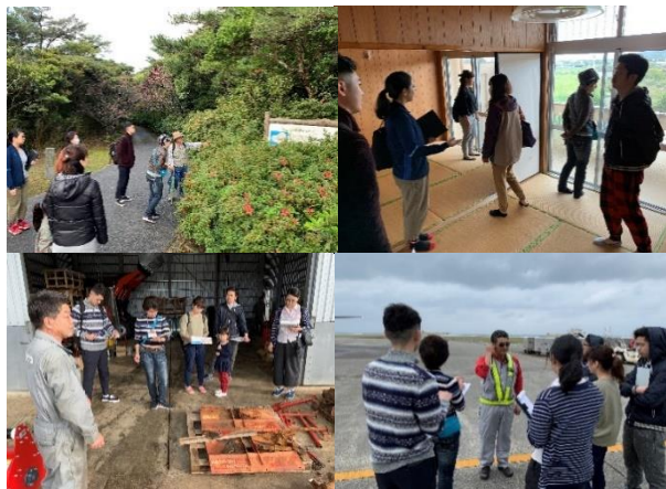
※昨年度のツアーの様子です。

※物件は見学予定ですが、斡旋は予定しておりません。また仕事の斡旋も予定しておりませんので、予めご了承ください。