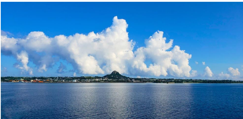
美ら海水族館から見える伊江島

沖縄の離島の中でも片道フェリーで30分の便利な島「伊江島」 あなたのスキルを活かしながら、地域の方々と一緒に 「魅力ある島」をつくりませんか？