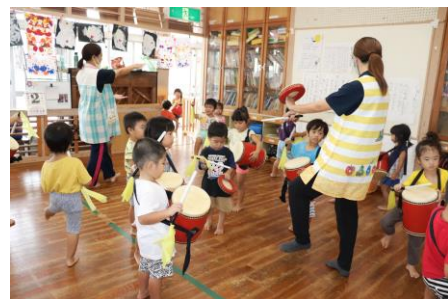
子育て支援が充実