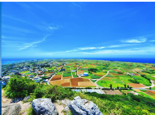
城山(ぐすくやま) 山頂のパノラマ